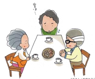
イラスト：松島むらう©