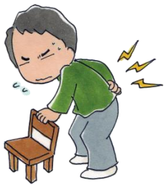
イラスト：松島むらう©